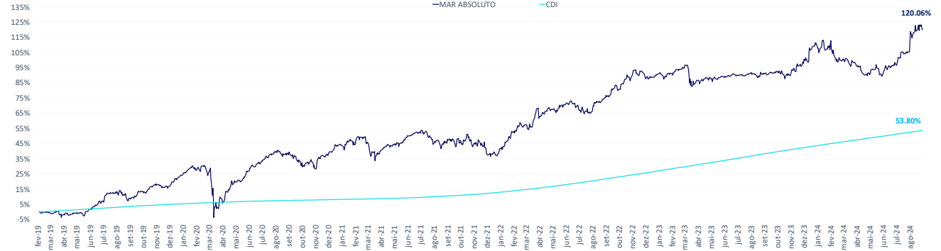
Atribuição de Performance - Desde o Início* e 12 meses