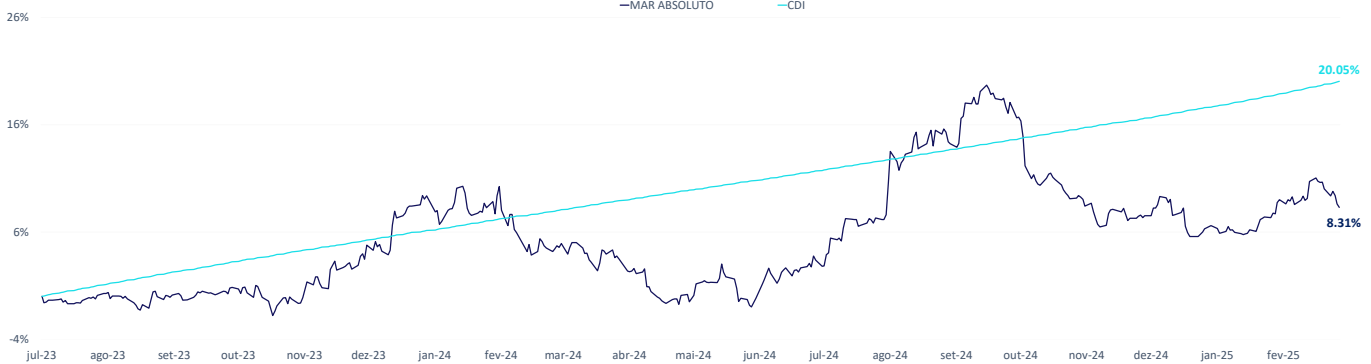
Atribuição de Performance - Desde o Início* e 12 meses***